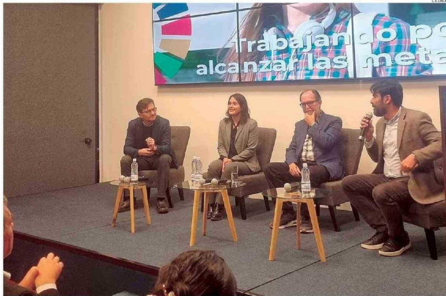
EL INFORME FUE PRESENTADO EN EL AUDITORIO DEL MERCURIO DE ANTOFAGASTA.

Sin embargo, el académico alerta sobre los puntos críticos para la región, puntualizando