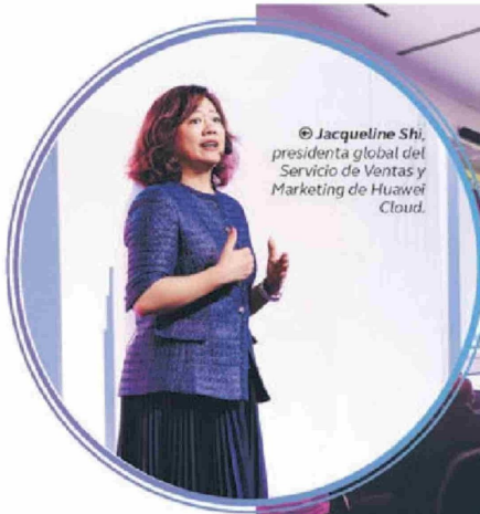
© Jacqueline Shi, presidenta global del Servicio de Ventas y Marketing de Huawei Cloud.