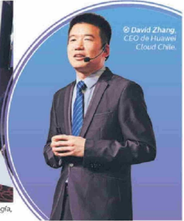
© David Zhang, CEO de Huawei Cloud Chile.