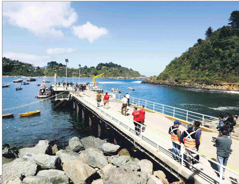
La lancha zarpo desde Bahía Mansa la mañana del 26 de enero y se hundió cerca de las 19:30 horas en aguas próximas a la bahía.

“De acuerdo a información de la Policía Marítima, el registro de zarpe no coincide con el número de personas que hemos reportado de este lamentable accidente. De todas maneras, todos los antecedentes están siendo investigados por la fiscalía y la policía marítima”, afirmó la delegada