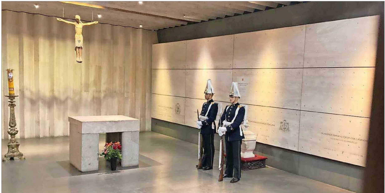
Guardia de honor Cadetes de la Escuela Militar se encuentran custodiando las ánforas en la cripta arzobispal, mientras se realiza la mantención de sus urnas.

DURANTE LABORES DE MANTENCIÓN QUE SE REALIZAN CADA 50 AÑOS, APROXIMADAMENTE: