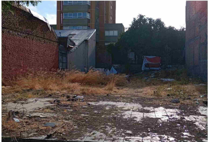
EN PLENO CENTRO DE LA CIUDAD está el sitio eriazo denunciado por los vecinos del sector.

"Te piden cosas, y si no les das, te amenazan. Incluso han dicho que las casas serán incendiadas. Es insólito y preocupante. Los Ángeles siempre fue una ciudad tranquila, donde la gente podía caminar segura. Cuando vienen