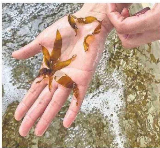
EL PROYECTO VA EN LÍNEA CON LA META DE CARBONO NEUTRALIDAD A 2040.