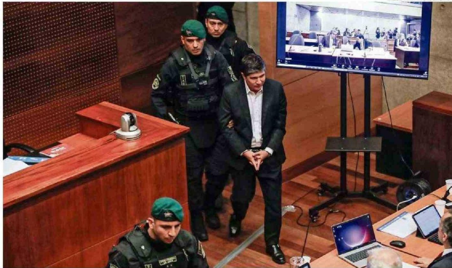
EL EXSUBSECRETARIO MANUEL MONSALVE AL MOMENTO DE INGRESAR A LA SALA 103 DEL SÉPTIMO JUZGADO DE GARANTÍA DE SANTIAGO.

Esto porque el también exdiputado permanece desde la salida del tribunal en calidad de “en tránsito”, detenido en un cuartel de la Brigada de Homicidios de la PDI a la espera de medidas cautelares. La Fiscalía pide pri-