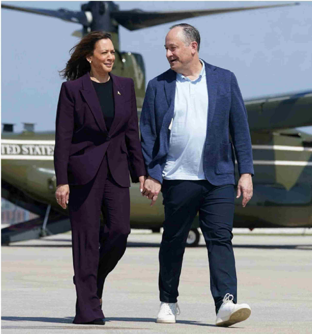
► Kamala Harris y su esposo Doug Emhoff, en Chicago, Illinois.

demócratas que estaban desilusionados con Biden se han pasado a Harris.