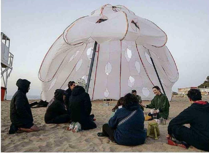
LA CARPA FUE DISEÑADA CON MATERIALES RECICLADOS.