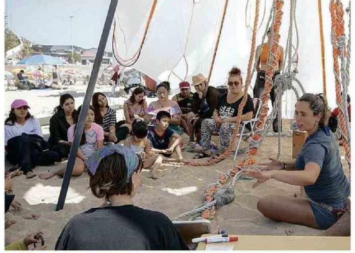
OFRECIERON CREACIONES INSPIRADAS EN LAS MEDUSAS Y TALLERES PARA TODO PÚBLICO.