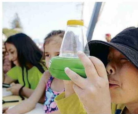
NIÑOS Y ADULTOS EXPLORARON LA BIODIVERSIDAD.