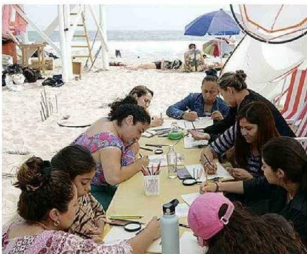
TALLERES CONECTARON ARTE, CIENCIA Y LA COMUNIDAD COSTERA.