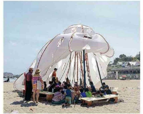
LA CARPA DE LA MEDUSA EN PLAYA CHICA DE LAS CRUCES.