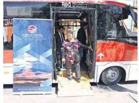
MICROBUSES CUENTAN CON TECNOLOGÍA Y ACCESOS UNIVERSALES.

Viveros dijo también que “la posibilidad de hacer un cambio a lo digital en cuanto al pago de un pasaje, ya está en proceso y que fue informado por el ministerio; y que en la región incluirá a las comunas de Antofagasta, Calama y Tocopilla. Este se encuentra en toma de razón por Contraloría, y luego se hará la licitación que proveerá el servicio. Pudiendo pagar con el mismo dispositivo en cualquiera de estas comu-