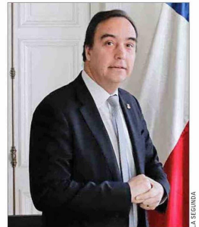
Gobernador de Magallanes y la Antártica, Jorge Flies .