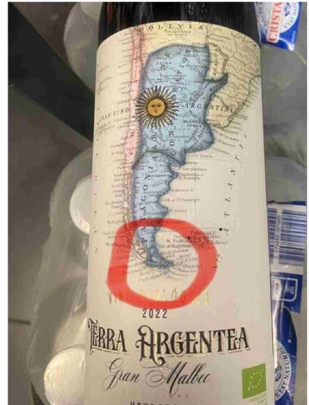
El vino argentino muestra un polémico mapa como su etiqueta ante el mundo.