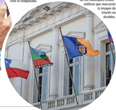
Santiago será uno de los municipios emblemáticos que marcarán la imagen de triunfo de alcaldes.