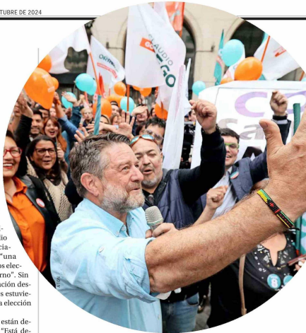
Un eventual triunfo arrollador de Claudio Orrego no lo catapulta inmediatamente como carta presidencial, cree el exdiputado.

En cuanto a los efectos para la candidatura presidencial de Evelyn Matthei, el analista dice que el riesgo es el lastre que pueden significar sus partidos, pero que "es evidente que ella va a tener más alcaldías de donde poder proyectarse que las que tiene hoy. La pregunta es cuánto gana".