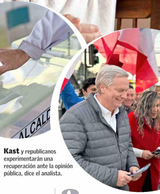
Kast y republicanos experimentarán una recuperación ante la opinión pública, dice el analista.

Sin embargo, dice que depende de dónde se pone la mirada, pues aunque aumenta este tipo de sufragio, también lo hacen los votos válidos, lo que considera positivo. ■