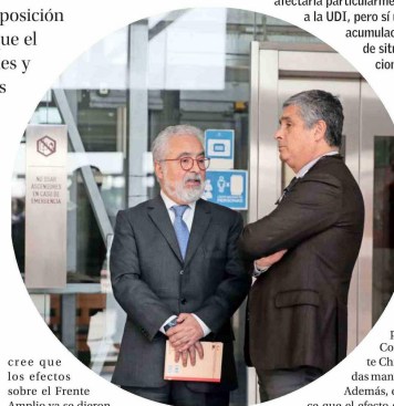
cree que los efectos sobre el Frente Amplio ya se dieron.