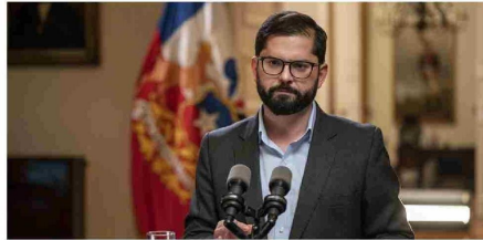
El Presidente Boric visitará Punta Arenas, San Gregorio, Primavera y Porvenir, donde abordará temas de conectividad, obras públicas y cultura.

El presidente Gabriel Boric inicia mañana una gira por Magallanes, la cual se extenderá hasta el viernes.