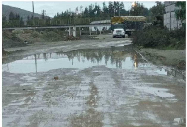
En la comuna de Punitaqui no se generaron grandes inconvenientes con el agua caída.

Por otra parte, el alcalde de Coquimbo, Ali Manouchehri dijo que "activamos de manera preventiva nuestro Comité de Gestión del Riesgo de Desastres (COGRID) municipal, donde se integran todos los departamentos (...) y esta semana continuaremos realizando acciones preventivas y atentos a los pronósticos climáticos".