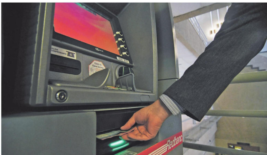
Recomendación. Expertos aconsejan hacer transacciones online y no de manera presencial.