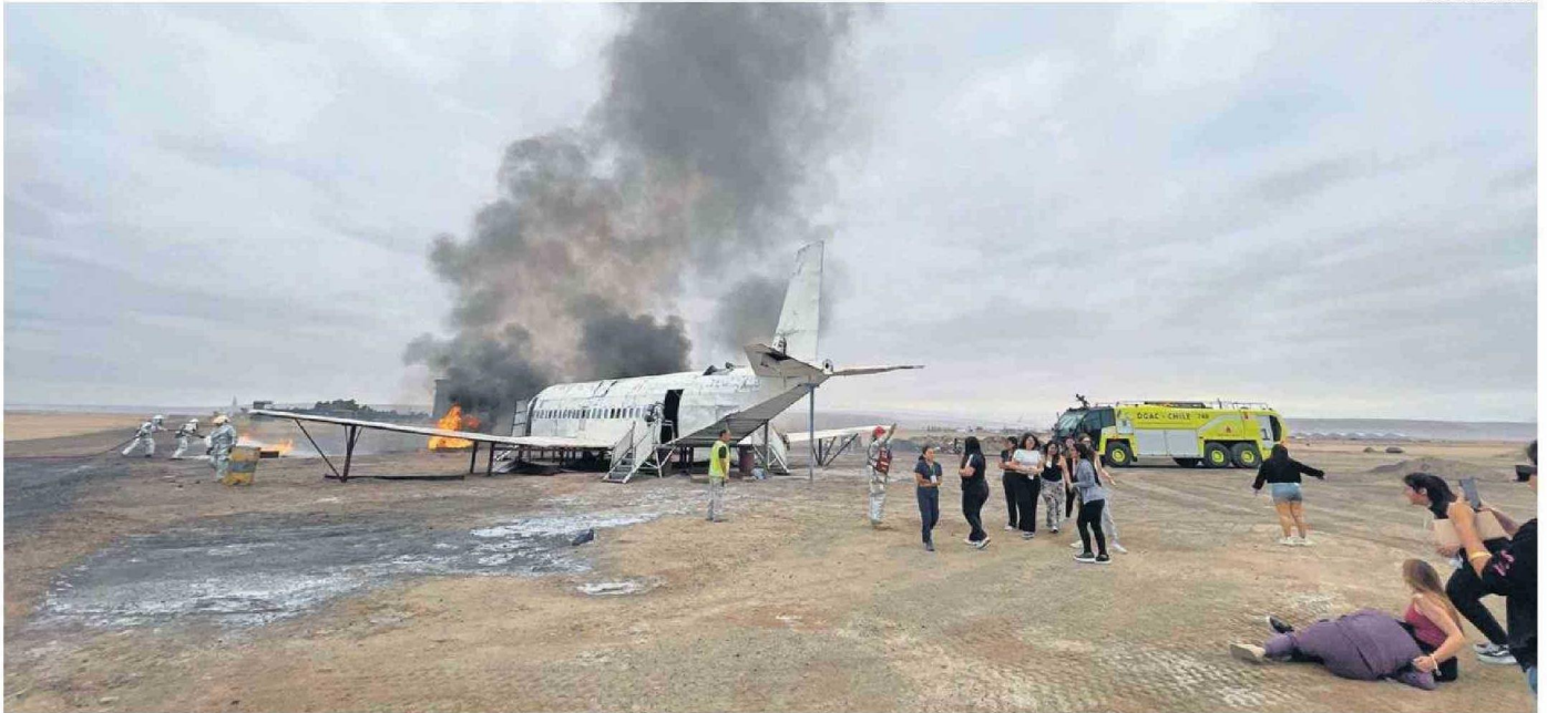
SIMULACRO DE ACCIDENTE AÉREO PERMITIÓ EVALUAR CAPACIDAD DE RESPUESTA ANTE UNA EMERGENCIA REAL.