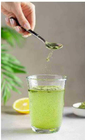
Suplemento alimenticio.

Los 'espejos inteligentes' (interactivos, con IA y equipados con cámaras y sensores), capaces de identificar a una persona, presentar imágenes e incluso mostrarlas sobre su cuerpo reflejado para mostrarle distintas apariencias que podría tener, además de sugerirle ejercicios y recomendaciones, son una de las herramientas más avanzadas de este tipo de tecnología. 📺