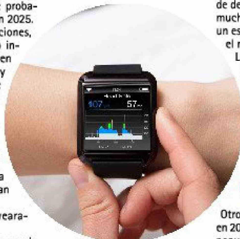
Reloj inteligente.

Algunas prácticas como los baños de sonido (de gongs, diapasones y cuencos de cristal), la meditación y las terapias de frío y calor están ganando terreno, como parte del enfoque holístico, que considera al cuerpo y la mente como un todo en vez de algo separado, y que la salud física y el bienestar mental y emocional de una persona está vinculados, según LFT.