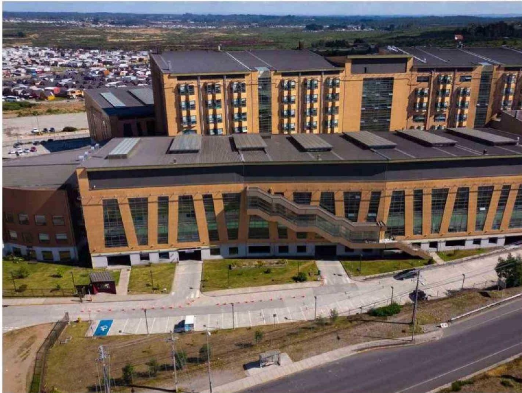
AL INTERIOR DE UNA RESIDENCIA USADA POR LOS TRABAJADORES DE TURNO HABRÍA OCURRIDO LA VIOLACIÓN.