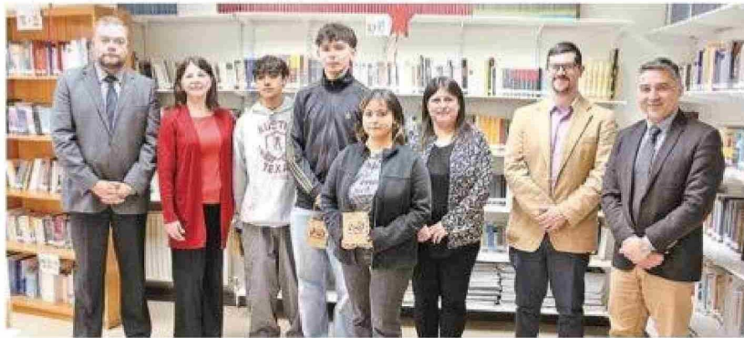
El homenaje del Slep a los mejores puntajes en Natales.

Benjamín destacó las enseñanzas que recibió en su colegio, especialmente las orientadas a formar personas íntegras. "Más que educación, nos inculcaron valores que nos ayudarán en la vida", expresó emocionado. Reconoció recientemente por las autoridades locales, compartió un mensaje para quienes enfrentan la Paes: "Yo les diría que de repente no se pongan tan nerviosos, que si tienen objetivos, que si tienen dudas, que se esfuerzen, que no piensen que es el fin del mundo, y de repente si les va mal, que van a tener una segunda oportunidad, y que deben estar tranquilos y confiar en ellos mismos".