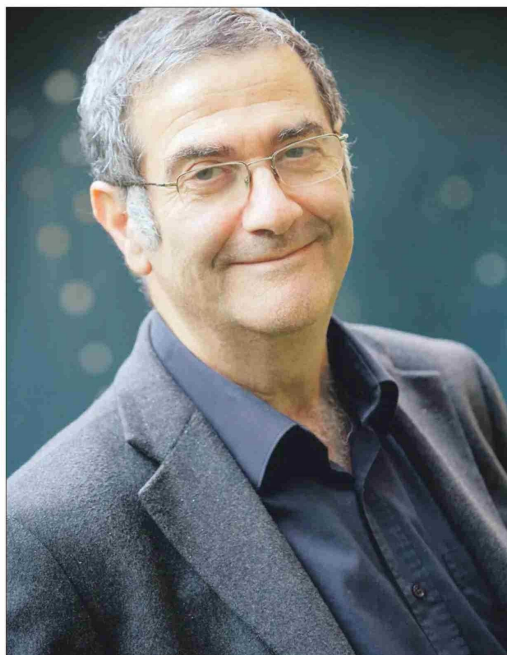
El francés Serge Haroche, premio Nobel de Física 2012 expondrá el miércoles 15 a las 15 horas.