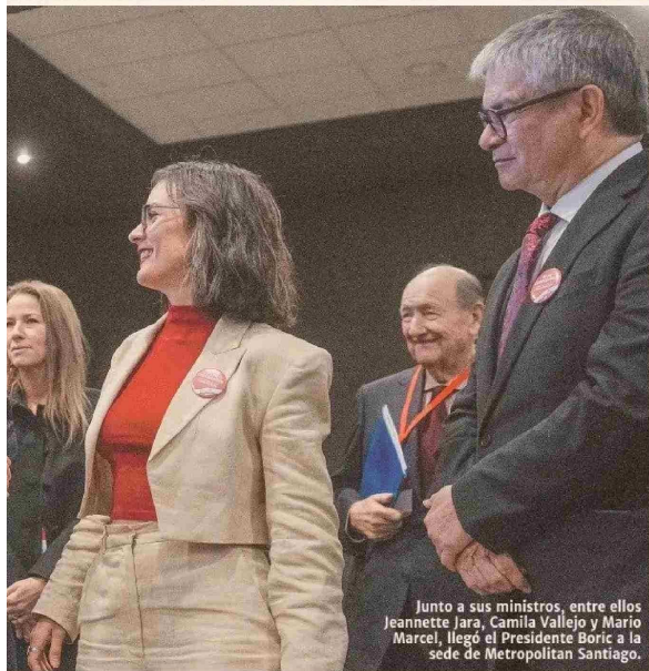
Junto a sus ministros, entre ellos Jeannette Jara, Camila Vallejo y Mario Marcel, llegó el Presidente Boric a la sede de Metropolitan Santiago.