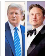
Trump lanza duros reproches a Biden y Harris en entrevista con Elon Musk. | A 5

Carrera por la Casa Blanca Las finanzas personales de los candidatos a vicepresidente Tim Walz y JD Vance no podrían ser más diferentes. | B 5