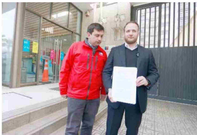
Tras reunirse con el fiscal regional, el parlamentario aseguró que ya se abrió una carpeta investigativa.

Según lo señalado por el legislador, ya se abrió una carpeta de investigación. "Hemos sostenido una reunión con el fiscal regional, quién nos ha confirmado que ya se ha abierto una carpeta de investigación por los hechos que puedan ser constitutivos a delito respecto a la situación. Nosotros pedimos que se investigue el conjunto,