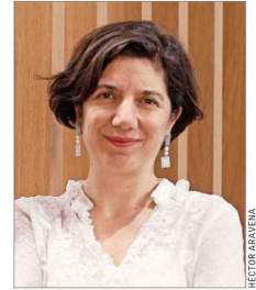
Ministra de Ciencia, Aisén Etcheberry.

to en I+D) va a continuar creciendo, al menos a una velocidad como la que estamos viendo ahora", asegura Etcheberry.