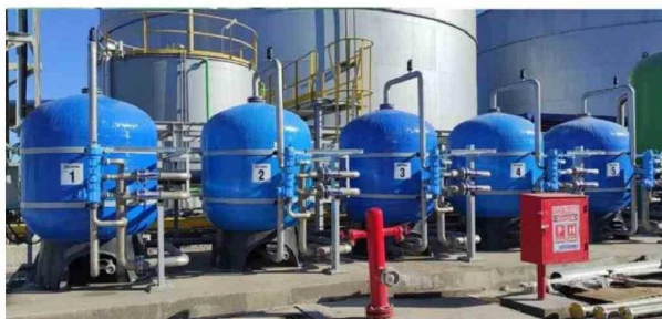
Sus filtros, y el resto de sus soluciones, se adaptan a las necesidades de cada cliente.