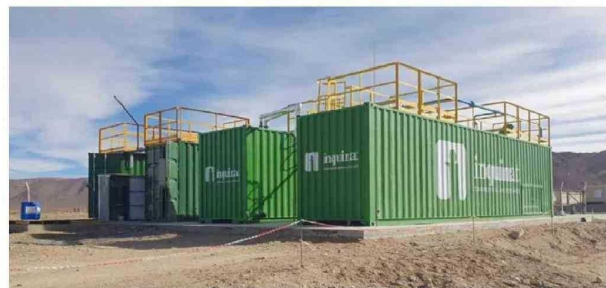
Planta de tratamiento de efluentes en contenedores, ideal para faenas mineras.