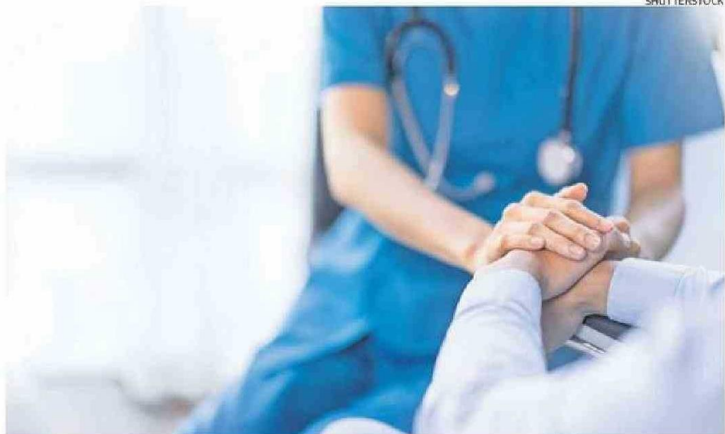
DORMIR LO SUFICIENTE DEBERÍA SER PARTE DEL TRATAMIENTO MÉDICO DE RECUPERACIÓN.

Los investigadores utilizaron primero modelos de ratón para descubrir este fenómeno; indujeron infartos en la mitad de los ratones y realizaron análisis celulares y de imágenes de alta resolución, además de utilizar dispositivos electroencefalográficos inalámbricos implantables para registrar las señales eléctricas de sus cerebros y analizar los patrones de sueño.