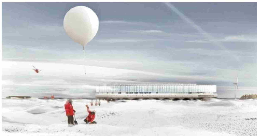
La imagen virtual muestra una panorámica del edificio en invierno.

El objetivo del Cai es claro: transformarse en el principal espacio de cooperación regional, nacional e internacional para el desarrollo de la ciencia y la cultura, además de potenciar a Punta Arenas como el centro logístico más importante como puerta de entrada a la zona occidental de la Antártica. No menor es una tercera meta: incentivar a la población a sumergirse dentro de la cultura