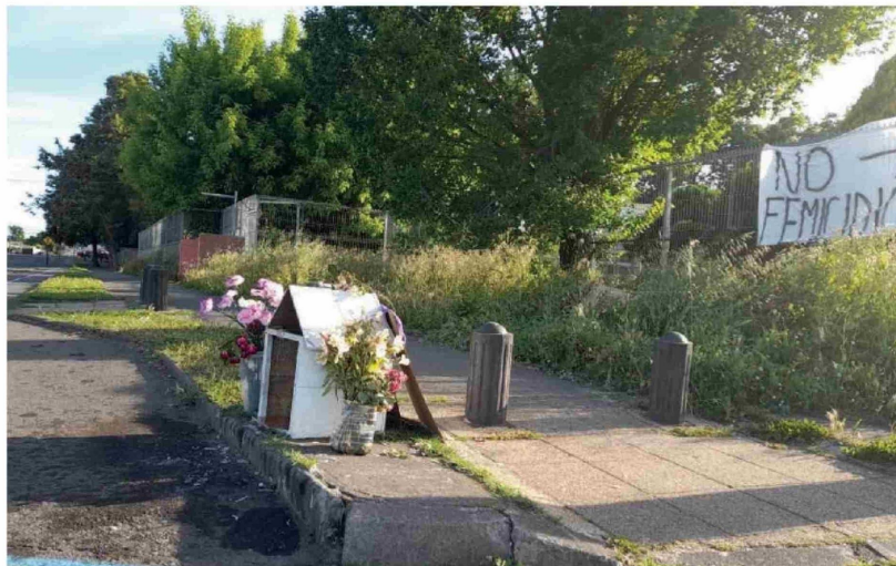
UNA GRUTA SE LEVANTÓ en el lugar donde fue asesinada la mujer de 47 años a manos de su ex pareja.