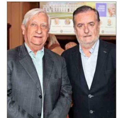
Cristián Millar y el diputado Francisco Undurraga.