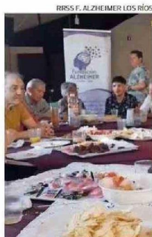
FUNCIONA DESDE EL 2017.

● Fundación Alzheimer Los Ríos Organización sin fines de lucro dedicada desde el año 2017 a educar, concientizar, sensibilizar, acompañar y asesorar a pacientes, familias, cuidadores y amigos de personas con Alzheimer y otras demencias. Cada año lideran y participan en actividades abiertas a la comunidad, tanto en Valdivia como en el resto de la Región de Los Ríos.