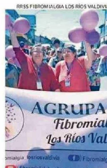
LA AGRUPACIÓN VALDIVIANA.

● Fundación Alzheimer Los Ríos Organización sin fines de lucro dedicada desde el año 2017 a educar, concientizar, sensibilizar, acompañar y asesorar a pacientes, familias, cuidadores y amigos de personas con Alzheimer y otras demencias. Cada año lideran y participan en actividades abiertas a la comunidad, tanto en Valdivia como en el resto de la Región de Los Ríos.