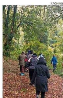
PARQUE URBANO EL BOSQUE.