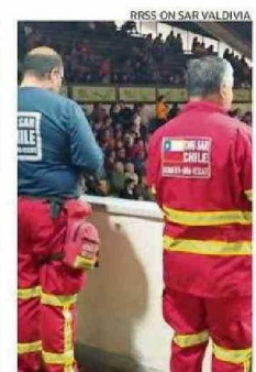
FUE CREADA HACE SEIS AÑOS.

● Agrupación Fibromialgia Los Ríos Valdivia Funciona desde hace dos años y reúne a mujeres diagnosticadas con fibromialgia que se han unido para combatir los prejuicios y la desinformación, en relación a este tipo de enfermedad crónica. La institución desarrolla un trabajo también basado en el apoyo emocional y la educación de la comunidad. Contacto es fibromialgialosriosvaldivia@gmail.com .