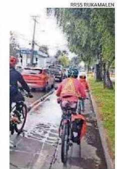
PEDALEOS EN VALDIVIA.

● Lafkenlif Organización medio ambiental. Su nombre, que significa "aguas limpias" en mapudungún, refleja su compromiso con la conservación del medio ambiente. Desde el 2017 se dedica a la limpieza de playas y educación medioambiental en la comunidad costera de la Región de Los Ríos, destacando la importancia de educar sobre el impacto de los desechos en los ecosistemas acuáticos.