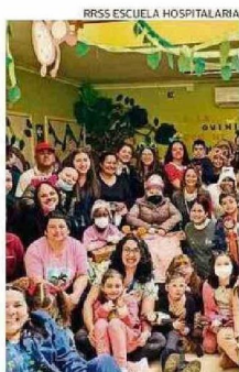
LA ESCUELA HOSPITALARIA.

● Escuela Hospitalaria Valdivia Tiene más de dos décadas de funcionamiento y única en su tipo, en la Región de Los Ríos. Ha cumplido un rol crucial a la hora de apoyar académicamente y bajo los lineamientos del Ministerio de Educación, a quienes son pacientes infanto-juveniles con patologías crónicas y agudas, mayoritariamente oncológicas. Opera como un colegio regular.