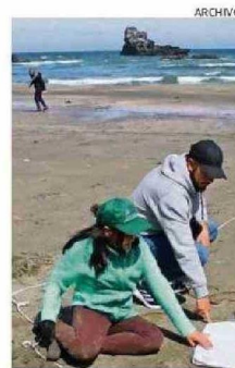
LIMPIEZA DE PLAYAS.