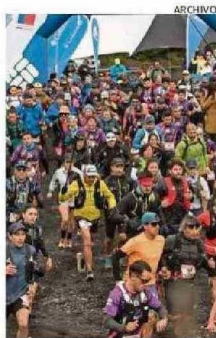
LA COMPETANCIA TORRENCIAL