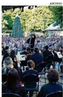
CONCIERTO "EL MESÍAS".