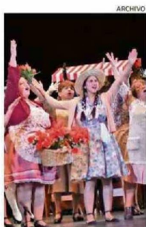
ESTRENO EN TEATRO CERVANTES.