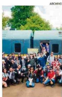
EL TREN VIAJÓ EN NOVIEMBRE.