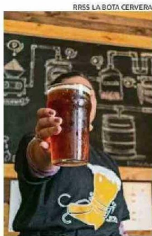
LA BOTA CERVECERA.