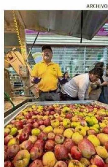
EL EVENTO DEBUTÓ EN 2024.