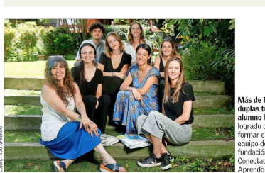
Más de 8 mil duplas tutor-alumno han logrado conformar el equipo de la fundación Conectado Aprendo.