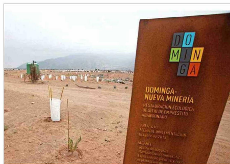
Es tercera vez que un Comité de Ministros se pronunciará sobre el proyecto minero-portuario Dominga.

En este sentido, quien debiese asistir a la reunión por parte de la cartera de Salud es la subsecretaria de Salud Pública, An-