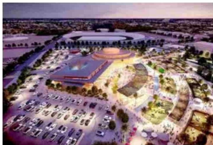
La imagen es una vista aérea de la maqueta virtual del proyecto, con la distribución de los espacios para estacionamientos, recinto ferial, parques, casino y boulevard, entre otros.