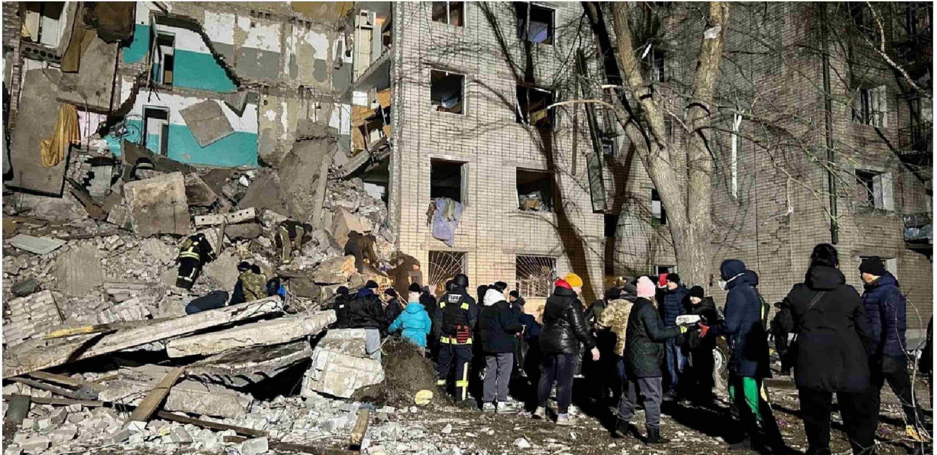
► Rescatistas y voluntarios retiran escombros en el lugar de un edificio residencial alcanzado por un ataque con drones rusos, en la ciudad de Hlukhiv, Ucrania.