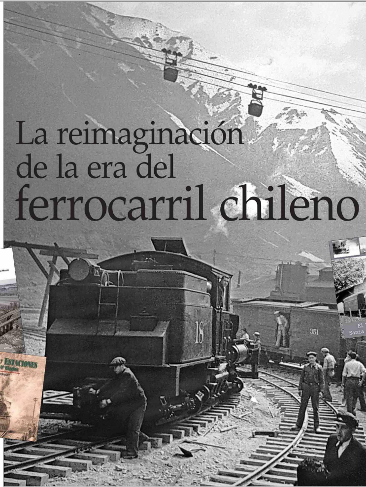
La locomotora Stay N°18 en la estación La Junta, hacia 1942. En la altura se observan los capachos del andarivel que bajaba el concentrado de cobre. El ferrocarril minero de Rancagua-Sewell marcó una época en la red de tendidos.

"Ferrocarriles y estaciones de la Región de O'Higgins" (Ricaaventura) recorre estación por estación, con descripciones y más de 250 fotografías históricas contrastadas con las actuales, recuperando así el mapa del ferrocarril longitudinal y sus cuatro ramales. "El sistema tiene 57 estaciones y se encuentra en estado de deterioro medio: algunas, como la de San Francisco de Mostaza, son un ejemplo de recuperación, pero otras, como la de Chimbarongo, son casos