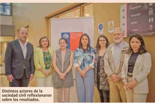
Distintos actores de la sociedad civil reflexionaron sobre los resultados.