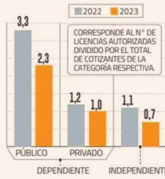
LICENCIAS MÉDICAS AUTORIZADAS EN PROMEDIO POR TRABAJADOR