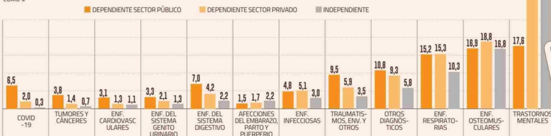
DISTRIBUCIÓN DE LAS LICENCIAS AUTORIZADAS EN 2023 POR GRUPO DE DIAGNÓSTICO SEGÚN TIPO DE TRABAJADOR COMO %