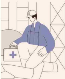
EN BASE A SUSSESO Y AL DE EMPLEO DEL IINE.

“El total de días de licencia al año pagados en promedio por trabajador dependiente del sector público es considerablemente mayor al observado entre trabajadores dependientes del sector privado e independientes.