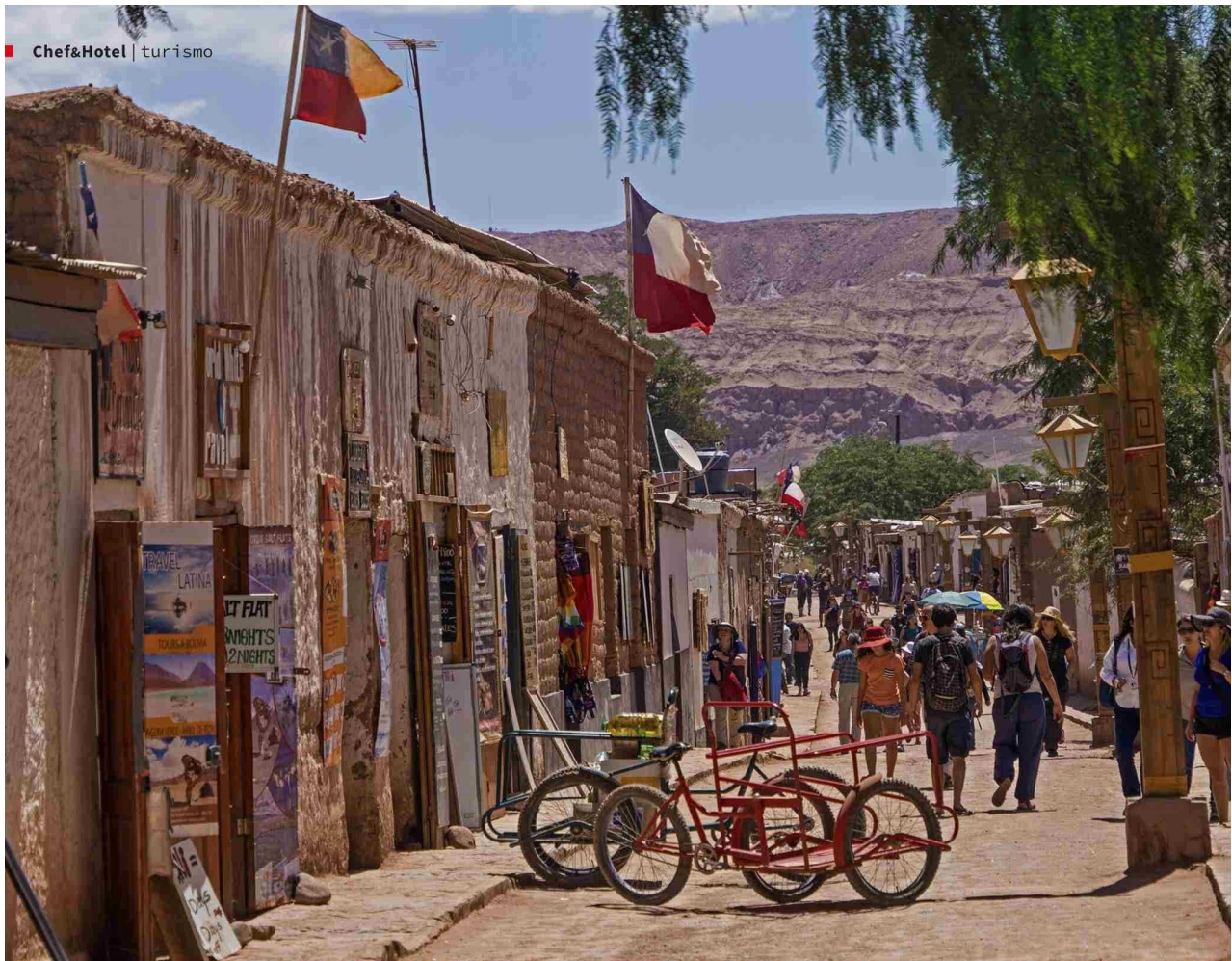
SAN PEDRO DE AT.