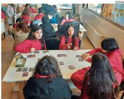
Alumnos del colegio Altamira de Coyhaique probaron el juego.

te que primero logre reunir cuatro "colecciones".