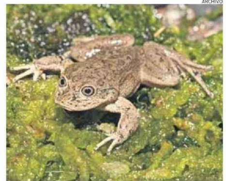
LA RANITA DEL LOA EN PELIGRO DE EXTINCIÓN AFECTADA POR INCENDIO.