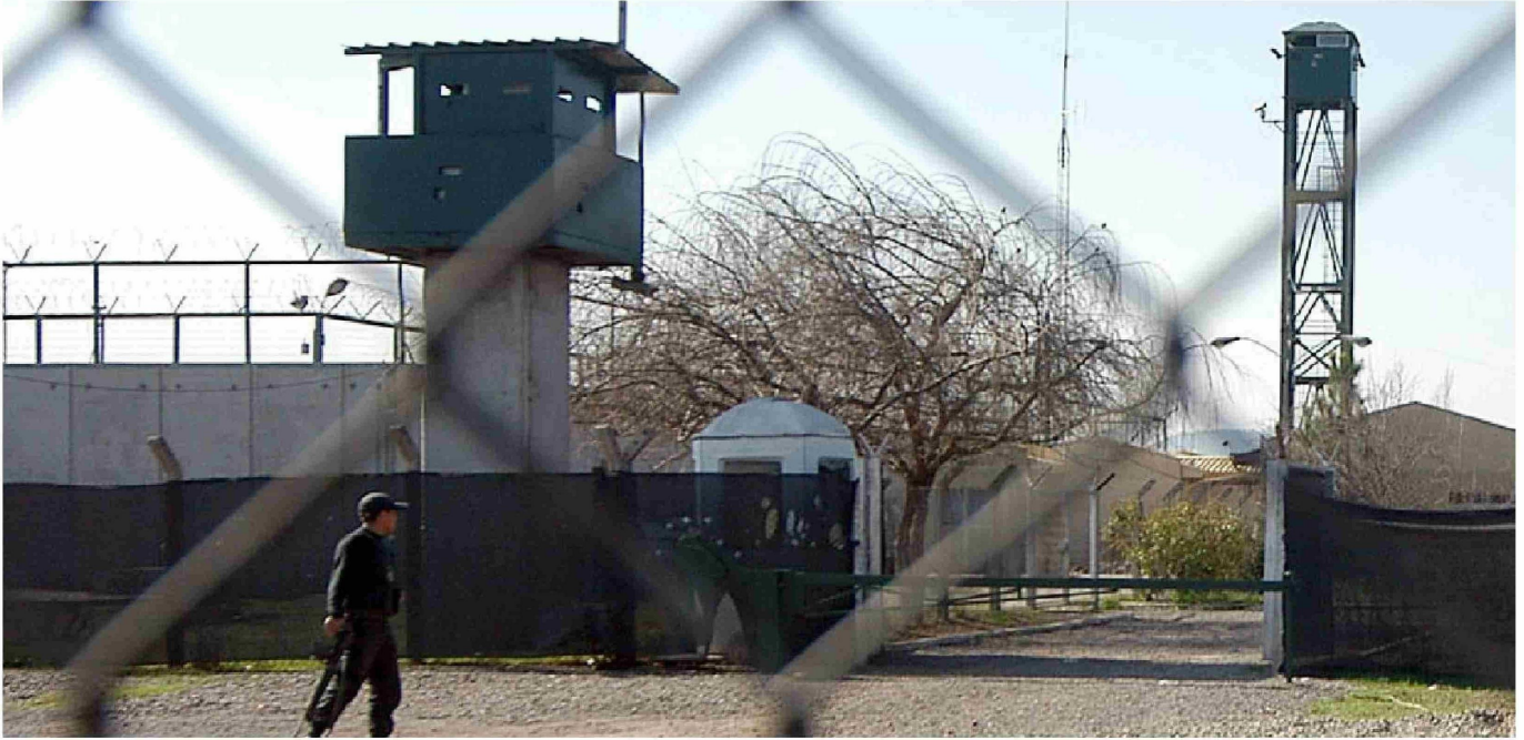
► Antes de ser Presidente, en varias oportunidades, Boric planteó que era partidario de cerrar el penal.