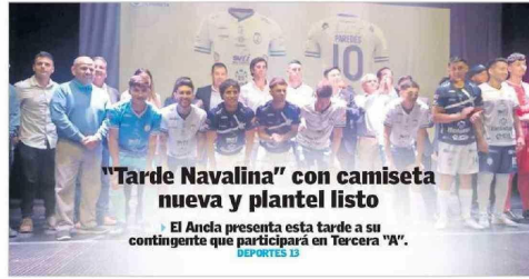
"Tarde Navalina" con camiseta nueva y plantel listo