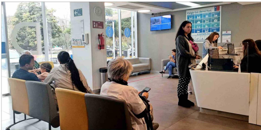
SONDEO.— La encuesta consideró a 1.200 personas de entre 18 a 85 años, residentes de las regiones de Valparaíso, Biobío y Santiago, y se realizó entre julio y agosto.

Encuesta remarca que las personas valoran los grados de libertad antes que la imposición de una fórmula. Expertos plantean que reformas deben incluir autonomía.