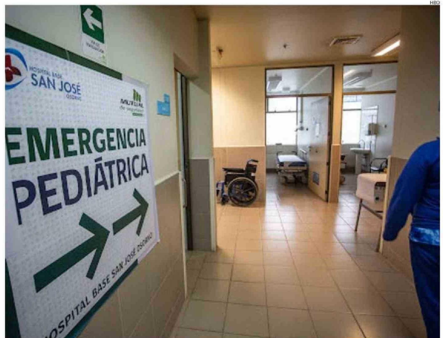
EN EL HOSPITAL BASE DE OSORNO TAMBIÉN EXISTE UNA ALTA DEMANDA POR LA ATENCIÓN DE MENORES DE EDAD DURANTE ESTAS SEMANAS.

Además, debido a la poca cantidad de médicos pediatras en la zona, muchos de ellos han optado por la atención 100% particular, con valores de consulta que superan los $50 mil, lo que para la gran mayoría de las familias resulta inaccesible. No obstante, aunque muchos optan por pagar, no