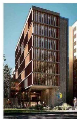
Hospital de Simulación Clínica