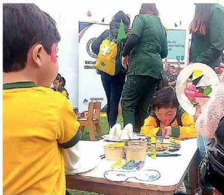
LO MEJOR ES IR A ACTIVIDADES AL AIRE LIBRE.

Una de las primeras recomendaciones que entregó a los padres es privilegiar actividades en espacios al aire libre, como plazas o parques. “Pero sabemos que eso no es posible siempre, por lo cual tene-