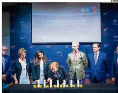
SOBREVIVIENTE DEL HOLOCAUSTO EN LA EMOTIVA CEREMONIA EN CHILE.

Yoav Kisch, pero no el primer ministro, Benjamin Netanyahu, contra quien la Corte Penal Internacional (CPI) emitió el año pasado una orden de arresto por crímenes de guerra y lesa humanidad, algo denunciado ayer por el ministro como un "ataque antisemita".