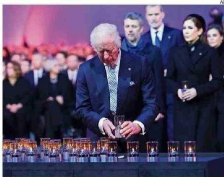
EL REY BRITÁNICO Y ATRÁS SUS PARES DE BÉLGICA Y ESPAÑA.