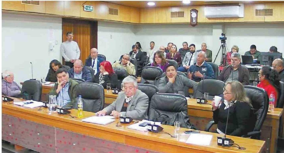
AGRIAS DISCUSIONES EN EL PLENO DEL CONSEJO REGIONAL SE DIERON EN EL MARCO DE LA DISCUSIÓN DEL PROYECTO DE PREUNIVERSITARIO.