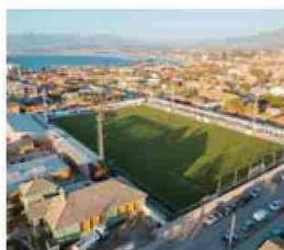
El estadio de Los Vilos cuenta con capacidad para 950 personas, cancha y camarines de primer nivel.