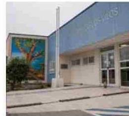
En materia de salud, en el marco de Somos Choapa se realizó el Centro de Diálisis de Los Vilos, la Posta de Salud Rural de Limahuida en Illapel, y el CESFAM de Valle Alto en Salamanca.

“Ha sido una mejora enorme para la comunidad y los profesionales que trabajamos acá. El hecho de tener una posta de primer nivel es algo muy positivo para la gente”.